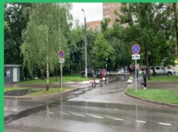
Установка знаков 3.27, совместно с табличками 8.24

Проведены работы по благоустройству дворовых территорий в рамках мероприятий по благоустройству дворовых территорий района Царицыно в 2021г. за счет средств стимулирования управ районов г. Москвы :